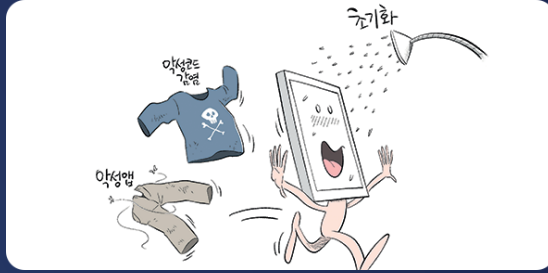
금융회사 피해신고 및 악성앱 삭제