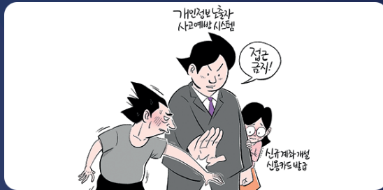
개인정보 노출사실 등록 [pd.fss.or.kr]