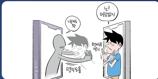
명의 도용된 휴대전화 개설 여부 조회 [www.msafar.or.kr]